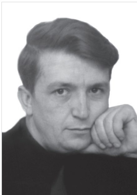
Фотографія автора 1970-х років

Я придився вільї України, і суревітєня мене не грізе. Та одній я, могомво, щось вимен, і вока миц простиць мачі все!