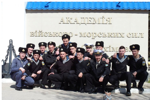
Прощальне фото курсантів Академії ВМС перед їх убуттям до Одеси