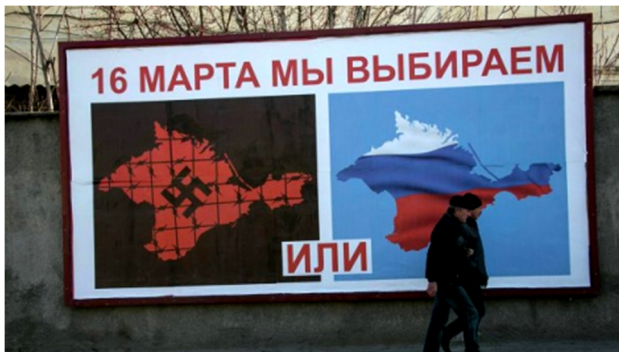
16.03.2014. Агітація в день проведення «референдуму»

ження Криму в складі України: «Ви за відновлення дії Конституції Республіки Крим 1992 року і за статус Криму як частини України?». Відповідь «проти» у бюлетені не передбачено. За українським законодавством, референдум може бути лише всеукраїнським. Західні