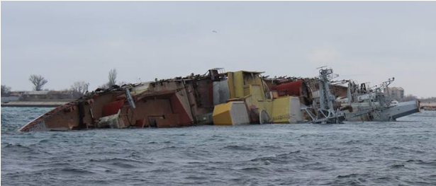
ВПК «Очаків», затоплений окупантами на фарватері виходу з озера Донузлав в море

О 6.30 ранку буксири ЧФ РФ вивели з Севастопольської бухти списаний великий протичовновий корабель (по укр. класифікації - фрегат) «Очаків», який, підірвавши, затопили на вході з моря в озеро Донузлав, перекрили фарватер і заблокували в озері 5-у бригаду надводних кораблів ВМС України: ВДК «Костянтин Ольшанський», СДК «Кіровоград», корвет «Вінниця», морські тральщики «Черкаси» і «Чернігів», базовий тральщик «Маріуполь», рейдовий тральщик «Генічеськ», та дивізіон суден забезпечення - близько 10