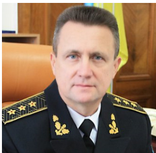
Адмірал Ігор Кабаненко

Озброєні російські окупанти вивезли на переговори у невідомому напрямку начальника Сімферопольського клінічного госпіталю імені святителя Луки полковника медичної служби Євгена Пивовара. Після нетривалого перебування на переговорах він здав госпіталь так званій кримській «самообороні».