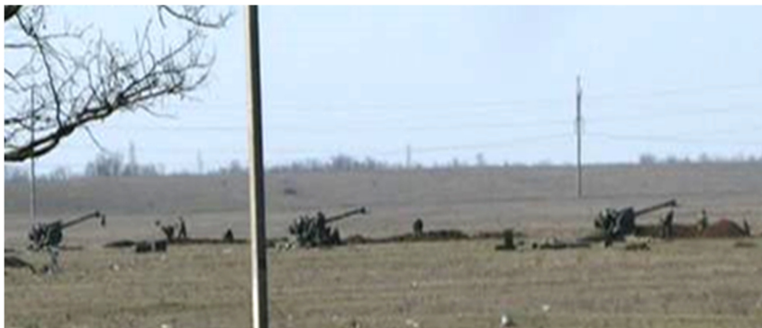
2014, березень. Батарея 122-мм гаубиць Д-30 збройних сил РФ на Турецькому валу направлена в сторону Херсонської області

артилерійських і мінометних батареї, танків і інших броньованих технічних засобів, знищення польових фортифікаційних і інших оборонних споруд, живої сили і вогневих засобів противника. А поряд видніються раніше розгорнуті артилерійські батареї 122-мм гаубиць Д-30 з дальністю стрільби понад 15 кілометрів.