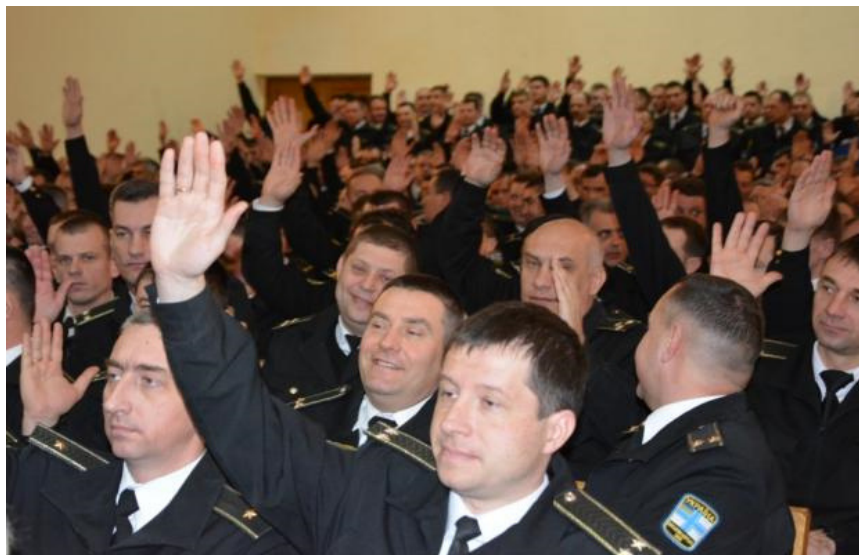
29.01.2014 Офіцери штабу ВМС підтримують звернення до Президента України з вимогою прийняти рішучі заходи проти народного протесту на Майдані