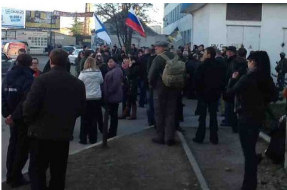
3.03.2014. Севастополь. Блокування штабу ВМС України сепаратистами