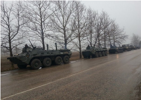
27.03.2014. Російські десантники на автошляху Бахчисарай - Сімферополь

Після захоплення урядових будівель в Сімферополі російськими військами і силами Чорноморського флоту з Севастополя, смт Гвардійське, навчального полігону Опук та Керчі розпочалося військове вторгнення і окупація Кримського півострову силами російських десантників, спецназу ГРУ ГШ ЗС РФ і морської піхоти Чорноморського флоту Росії.