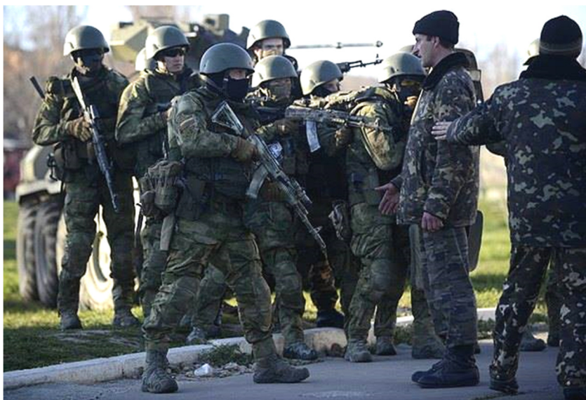
2014, березень. Севастополь, аеропорт Бельбек. Авіабригада ПС ЗС України. Протистояння грудьми проти російських автоматів

Спершу при допомозі спецназу і використовуючи тваринний страх кримської еліти за свої теплі місця, бізнес і власне благополуччя, створили маріонетковий уряд і проголосили курс Криму до незалежності... яка мала у той же час же завершитися приєднанням до Росії. Та на заваді цього плану стояли українські військовослужбовці, у першу чергу Військово-Морські сили України. Для їх нейт-