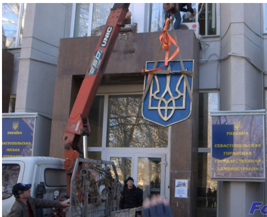
17.03.2014. Севастополь. З державної адміністрації знімають Державний Герб України

держорганів України, прийняті після 21 лютого 2014 року», - сказано в постанові. «Законодавство України, крім зазначеного в абзаці першому цього пункту, застосовується на території Республіки Крим до прийняття відповідних нормативних актів Республіки Крим».