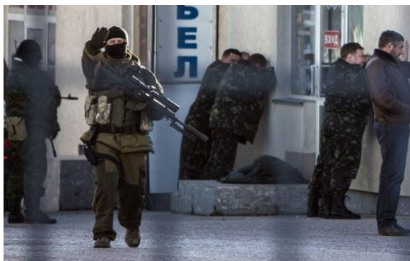
2014, березень. Фінал дружби флотами

Тим більше, що в наш час, в роки незалежної України, перша спроба впровадити в Україні подібний сценарій відбулася восени 2003 року з організації військово - політичної провокації навколо острова Тузла в Керченській протоці. Але тоді антиукраїнські сили ще не були організовані, їх вплив на суспільство був не значний, а українська влада у Криму, особливо прем'єр-міністр АРКриму Сергій Куніцин, і Військово-Морські сили (командувач віце-адмірал Ігор Князь) виступили спільно, продемонстрували єдність намірів і зусиль. Тому сили Чорноморського флоту хоч і привели в бойову готовність, однак задіяти їх тоді не ризикували. Ту, фактично першу, невдалу для Росії російсько-українську військово-політичну кризу дуже швидко заговорили вічною дружбою і слов'янським братством і рекомендували забути як якесь непорозуміння між місцевими керівниками Кубані і Криму. І хоча боротьба з спробою анексії ук-