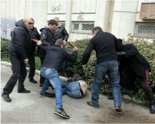
Побиття «тітушками» учасників мітингу на честь 200-річчя Тараса Шевченка у Севастополі

а у автомобіля вибили скло і фари. Таким побоїщем українців у Севастополі завершилося вшанування 200-літнього ювілею Великого Кобзаря, який уряди України і Росії планували вшанувати спільно, таким став останній загальноміський державницький захід української громади Севастополя: п'ятеро людей доставили швидкою допомогою до міської лікарні, одного – до військового шпиталю ВМС України, десяток осіб було побито, кілька автомобілів пошкоджено.