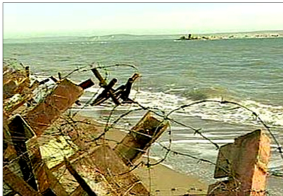
2003 р. Острів Тузла борониться, дамба приближується...

Для відповіді повернемося на десятиліття назад. Восени 2003 року розгорнувся конфлікт навколо українського острова Тузла в Керченській протоці, до якого з російського кубанського берега почали будувати широку дамбу. Це була перша спроба Росії гібридними методами, при допомозі п'ятої колони в Криму силою взяти під власний контроль судноплавство у Керченській протоці і Азовському морі, змінити внутріполітичну ситуацію в Україні, «стриножити» її і втягнути до «братської» союзної держави. Вибір часу анексії острова, а з ним і розвиток Керченської кризи, був вибраний