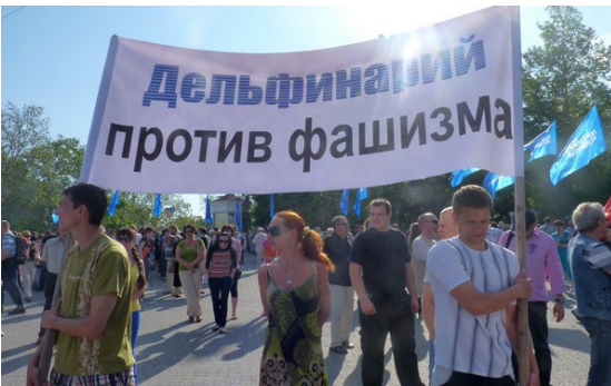
2013. Початок «антифашистської» боротьби у Севастополі

У результаті спеціальних інформаційних «антифашистських» і «антиНАТОВських» операцій, основу яких складало історичне минуле Севастополя і трагедії пережитих містом війн, ворогам України вдалося тут сформувався відмінний від інших регіонів України культурний код, який пов'язаний з містечковим шовінізмом та втратою здорового державного патріотизму. По-перше, сформована масова культура поширювала підозрілість та недовіру до людей, які ідентифікували себе патріотами України, їм стали приписувати найнижчі мотиви, ворожість до Росії, по-друге – розквітла культура маніпуляції фактами і викривлення історичного минулого, поширюються ідеологічне шахрайство та брехня як щоденні побутові і загальноприй-