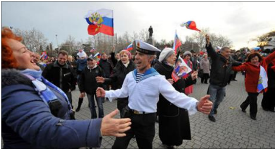
Свято падіння «українського іга» У Севастополі

почули запах влади і крові, самі вже не зупиняться! Тільки не треба розслаблюватися, все лише починається. Сила, яка їх поборе, повинна бути достатньо міцною, і жорстокою...». «З яких тільки закутків свідомості виповзають подібні гади, вони мають втямити, що боротьба з ними буде вестися з метою їх повного знищення», - звучить вже застерігаючи страшно для не «ісконно руських». Знаю, читав у севастопольському архіві, що подібні гасла і промови лунали на мітингах перед Варфоломіївськими ночами Севастополя, напередодні більшовицьких погромів у Севастополі 17 грудня 1917 і 23 лютого 1918 років. А далі, після грізних речей стосовно вчорашнього «проклятого прошлого» і аплодисментів підтримки сказаному, грала музика, виспівувала Бабкіна і витанцьовував народний ансамбль «Русь». Під гармошку з палаючими чи то від випавшого щастя, чи від вжитого горяченького напою, витанцьовує літній матрос-ветеран, беззмінний учасник всіх парадів і мітингів, у подарованій йому, напевно, на Чорноморському флоті новенькій