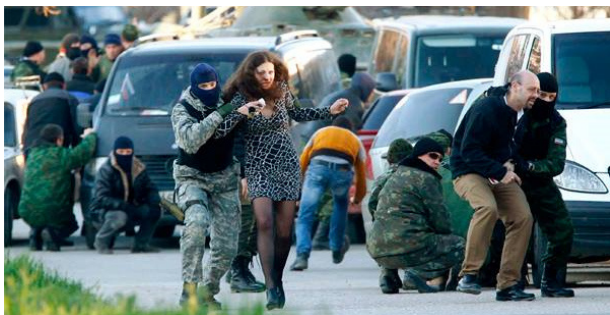
Бельбек. Окупанти штурмують авіабригаду, прикриваючись цивільними мешканцями

Вранці окупанти оточили 204-у бригаду тактичної авіації Повітряних сил Збройних Сил України імені тричі героя Радянського союзу О. Покришкіна, підтягнули важку бронетехніку і під звуки бойової сирени розпочали штурм. В ході штурму, на територію військової частини прорвалися представники бандформувань з «самооборони Криму» і спецназ ЗС РФ. Ворота і бетонний паркан авіабригади