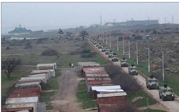
1.03.2014. Севастополь. Вивантаження російського спецназу, т. зв. «зелених чоловічків», в бухті Козача з ВДК ЧФ РФ «Н. Фільченков»

Російська агресія в Україні змушує по іншому подивитися і на реформу Збройних Сил України, особливо Військово-Морських сил, яку провадив міністр оборони Павло Лебедев і його поперед-