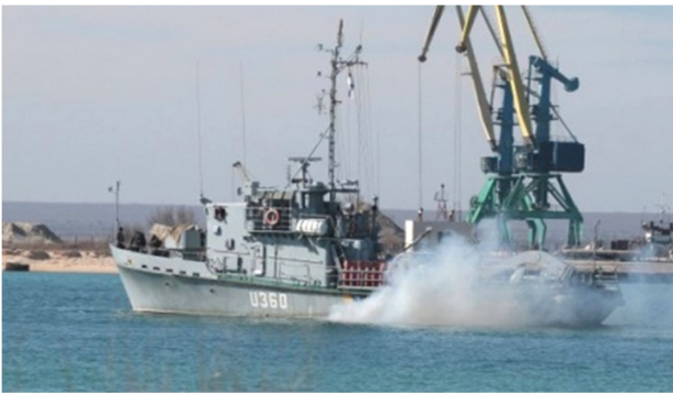
Рейдовий тральщик «Генічеськ» намагається вирватися з озера Донузлав

А у озері Донузлав і того гірше. Стальна барикада із затоплених суден на виході в море створила для кораблів ВМС ситуацію там просто безнадійною. Сил і засобів розблокувати вихід в море не було, корабельна зброя тут була безсилою, крім того, берег був