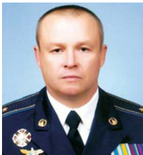
Генерал-майор Василь Черненко

У Криму розпочалося переслідування за національною ознакою і кримські українці стали побоюватися за власну безпеку та безпеку своїх дітей. У Севастополі і в Криму стало небезпечно демонструвати національну символіку України і розмовляти українською. Якщо відбувається якась дискримінація тієї чи іншої національної спільноти на території Криму, то це передусім стосується українців, а не проросійської частини населення чи загалом російської громади, яку сьогодні нібито захищають від якихось ворожих сил російські військовослужбовці, кажуть кримські українці. Вони вкрай негативно оцінюють останні події у Криму. Багато-хто вже намагається вивести своїх дітей із півострова. На материковій Україні появились біженці з Криму.