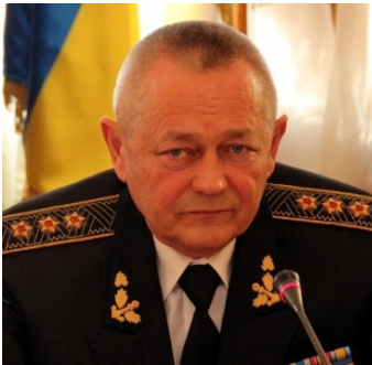
Адмірал Ігор Тенюх

В.о Міністра оборони України адмірал Ігор Тенюх пояснив, чому армія не дає відсіч російським окупантам. «Збройні сили України не мають юридичного права розпочати воєнні дії в Криму», про це під