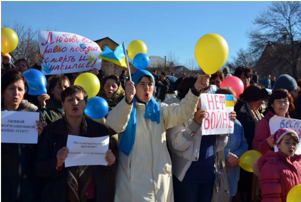
2014, березень. Протести кримських жінок проти російської агресії

Кілька сотень кримських жінок на шосе Сімферополь - Бахчисарай провели акцію протесту проти російського вторгнення у Крим, за мир і дружбу. Вони вишикувалися вздовж автотраси з українськими прапорами, жовтими і блакитними кульками і плакатами «Крим – це Україна», «Кохати, а не воювати», «Стоп Путін!», «Ми ростимо дітей для щастя і миру», «Кримські татари, росіяни, українці за мир», «Поверніть нам мир!» тощо. Мітингувальники скандували: «Ні війні!», «Крим за мир». Жінки розповіли журналістам, що їх хвилює і лякає вигляд озброєних до зубів російських військових без розпізнавальних знаків, військова техніка, агресивні російські козаки і «самооборонці», які формують бандитські угруповання. Учасники заходу заявили, що виступають за територіальну цілісність України і проти російської окупації Кримського півострова.