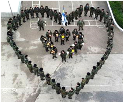
8.03 2014. Флешмоб у штабі ВМС України

У штабі ВМС України в умовах кругової блокади військовослужбовці привітали жінок штабу зі святом весни. Командувач ВМС України контр-адмірал Сергій Гайдук від імені всього особового складу ВМС України привітав жінок з Міжнародним жіночим днем. Командувач висловив найтепліші слова вдячності матерям і коханим, сестрам та дочкам які у складній ситуації вірять і підтримують військових моряків України. Офіцери і матроси, які знаходяться в блокаді,