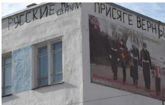
2014, березень. Гасла на стіні корпусу штабу ВМС під час його оборони від російських інтервентів

Що ж то у нас були за командири такі, хто їх призначав на