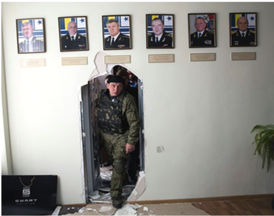
19.03.2014. Зруйнована окупантами стіна кабінету командувача ВМС ЗС України

Відсутність та не бажання зробити висновки з першої спроби гібридної «тузлинської» війни проти України, миролюбність і брак реальної служби як такої у Військово-Морських силах, як, між іншим, і у всіх інших силових структурах України в Криму, дозволила