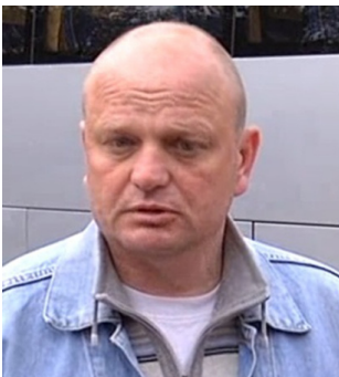
Полковник Ігор Бедзай

13:00. До в.о. командира 10-ї Сакської морської авіабригади Військово-Морських сил ЗС України (с. Новофедорівка, Саки, Крим) полковника авіації Ігора Бедзай прибули представники ЧФ РФ і Південного військового округу Збройних Сил РФ та виставили ультиматум, що якщо вони не здадуть їм бригаду із зброєю і технікою то їх будуть бомбити авіацією ЧФ РФ. Полковник Ігор Бедзай ультиматум відкинув.