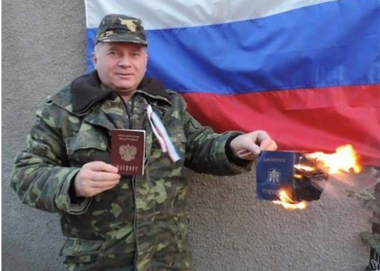
2014, березень. Сімферополь. Акція показової зради

З прибуттям Віктора Януковича до Севастополя загострення ситуації у Криму почало набувати особливого прискорення, у Севастополі по команді активізувалися сепаратисти і різні проросійські організації. Десь перед обідом 23 лютого 2014 року на заводі «Тавріда-Електрик» в компанії з народним депутатом від Партії регіонів Вадимом Колісниченком був замічений син Президента Олександр Янукович. Як повідомляли працівники цього заводу, вони там про щось радилися з власником заводу громадянином Російської Федерації Олексієм Чалим. А вже після обіду 23 лютого на площі Нахімова