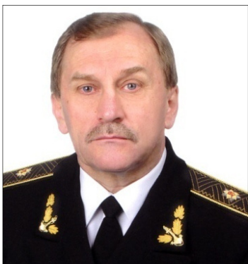
Контр-адмірал Микола Жибарев

З захопленням тральщика «Черкаси» Військово-Морські сили України втратили всі бойові кораблі з базуванням на Крим. А ось командувач морськими силами прикордонників контр-адмірал Микола Жибарев, один з фундаторів ВМС України, повторив свій ко-