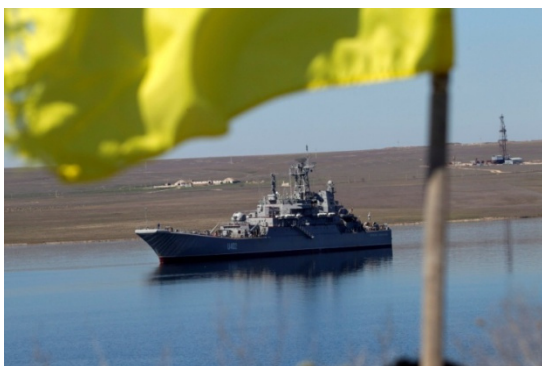
2014, березень. Озеро Донузлав. Підтримка з берега заблокованих кораблів ВМС України

Протипоставити щось організаційному і інформаційно-психологічному впливу РФ в Криму Військово-Морські сили, та й Україна в цілому, вже не могли нічого. Українська громада у Севастополі була розпорошена, малочисельна і без зв'язку з штабом ВМС, а занедбані протягом десятиліття інформаційно-пропагандистські структури ВМС України були повністю виведені з інформаційного поля Криму, та й хоч якогось інформаційного опору, крім окремих журналістів ВМС і загальнодержавних ЗМІ