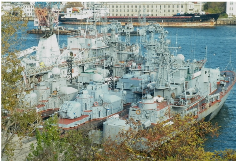
2014, жовтень. Інтерновані ЧФ РФ бойові кораблі ВМС ЗС України у Севастопольській бухті. Справа наліво: корвети «Хмельницький», «Тернопіль», «Луцьк».

Але Україна винесла з Криму не лише територіальні і матеріальні втрати. Попри поразку і зраду, з Криму ядро Військово-Морських сил України вийшло духовно оновленим, без ідеологічних примар, з зданим екзаменом на національну самосвідомість і військову доблесть. Його вже не купити на словоблуддя дешевої дружби. Їм, як і всім в Україні стала виразно ясною небезпека втратити незалежність, волю і свободу свого народу та ідеалів Майдану. За період так званого «силового протистояння» військових моряків у Криму в Україні перед ворогом і світом постала політична, об'єднана українська нація, з глибин якої, як колись в старі українські часи, піднявся незборимий козацький «дух, що тіло рве до бою», який мобілізував масовий патріотизм, героїзм і самопожертву, наслідком якого стало створення сотні бойових добровольчих батальйонів, які разом з іншими видами Збройних Сил України зупинили ворога у східних областях України. Вони ж і приведуть до перемоги!