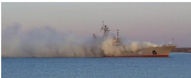
02.03.2014. ВДК «Костянтин Ольшанський» тримає оборону в озері Донузлав

Учора нам перегородили вихід з озера Донузлав три російські кораблі серед яких флагман Чорноморського флоту РФ ракетний крейсер «Москва», колишній «Слава», який може нести ядерну зброю. Ми звертаємось за підтримкою до світової спільноти. Дякуємо за підтримку. Слава Україні». Та з більш яскравим жанром того ж дня розповсюдив своє звернення екіпаж середнього десантного корабля «Кіровоград». Відчувалося, що яку носив корабель назву такий проявив і патріотизм: «Уважаемые жители Кировоградской области и всей Украины к Вам обращается экипаж среднего де-