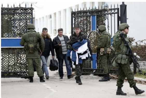
Офіцери покидають штаб ВМС України, який вже взяли під охорону російські десантники