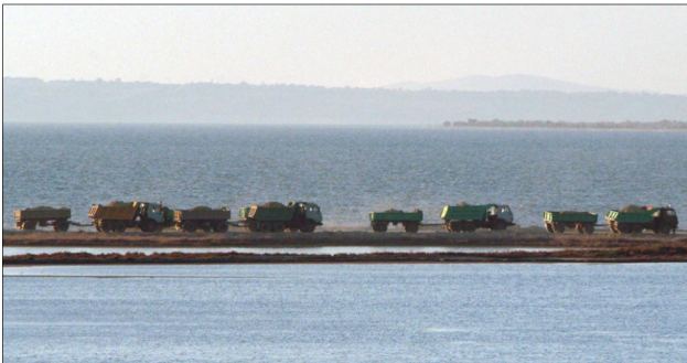
2003, жовтень. Дамба насипається

воду. Хватит издеваться над нами. Если надо, мы сделаем все возможное и невозможное, чтобы отстоять свою позицию. Если надо, мы сбросим туда бомбу!». У ві-