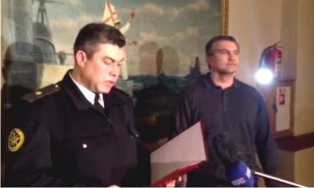
2.03.2014. Денис Березовський (зліва) складає присягу «мешканцям Криму і міста-героя Севастополя».