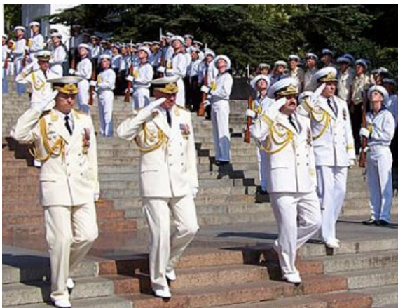
28.07.2013. Севастополь. Останнє спільне святкування Дня флоту України і ВМФ РФ

26 липня 2013 року. Севастополь. Зранку на обидва береги Севастопольської бухти вийшли десятки тисяч севастопольців, туристів і гостей міста. Каравани автобусів звозили народ з Ялти, Феодосії, Сімферополя, Євпаторії та з багатьох міст України. Цього дня у Севастопольській бухті проводилася генеральна репетиція спільного святкування Дня флоту України і Військово-Морського флоту Російської Федерація, взяти участь у якому 28 липня мали президенти України і Росії. За початковим сценарієм свята з двох великих десантних кораблів - українського «Костянтин Ольшанський» та російського «Новочеркасск» - повинна була імітуватися показова висадка десантів морської піхоти на 20 бронемашинах (БТР-80) з стрільбою штатним озброєнням. Перші дві бронемашини мали нести Державні прапори України і Російської Федерації, слідом за ними дві - Військово-морські прапори обох флотів. Однак «Костянтин Ольшанський», хоч і пройшов зовсім недавно ремонт на Чорноморському суднобудівному заводі в Миколаєві, виявився не готовим приймати участь у святкуванні – у нього, як і до ремонту, знову не відкривалася носова апарель, тож висадити десант морської піхоти не міг. Тому український корабель поставили у Артилерійській бухті на бочки, а висадку спільного десанту доручили забезпе-