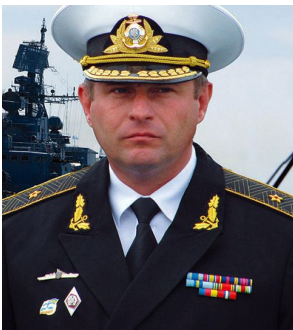
Контр-адмірал Андрій Тарасов

Ряд офіцерів, мічманів і матросів тральщика «Чернігів», командир якого прийняв рішення здатися російським окупантам, ввечері 22 березня 2014 перейшли на борт великого десантного корабля «Костянтин Ольшанський», який перебуває в центрі озера Донузлав і залишається вірним присязі і готується до оборони корабля.