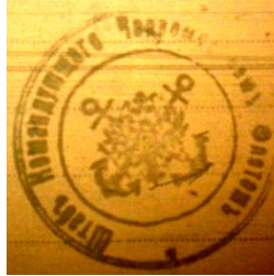
Печатка штабу Командувача ЧФ