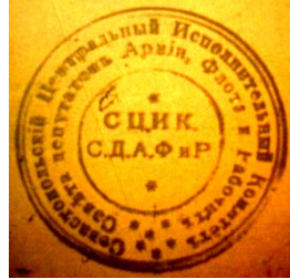
Печатка Центрального виконкому Севсовета