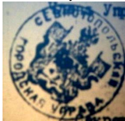
Печатка міської Управи Севастополя