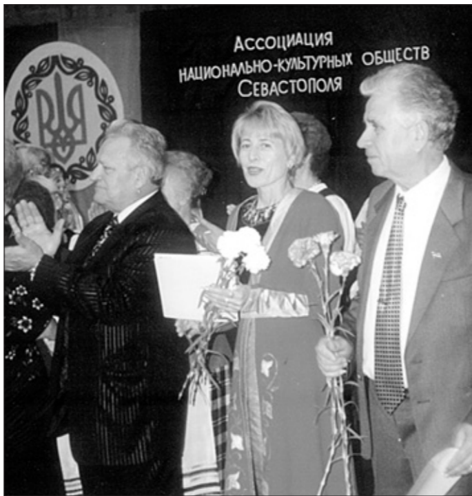
Форум національно-культурних товариств міста