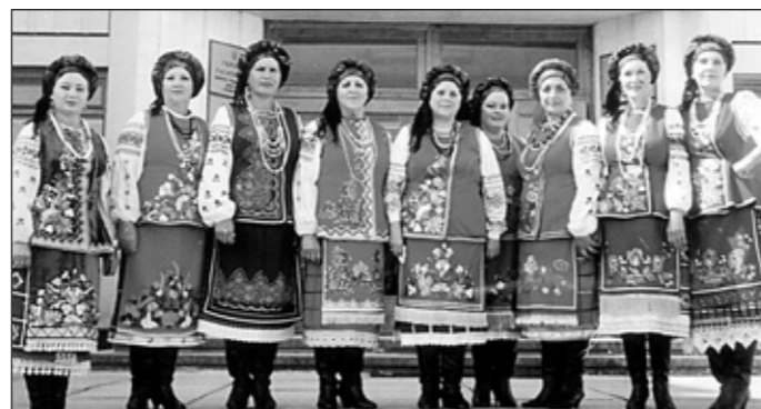
Народний фольклорний ансамбль