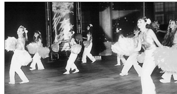
Шоу-група "Танцювальний рай"