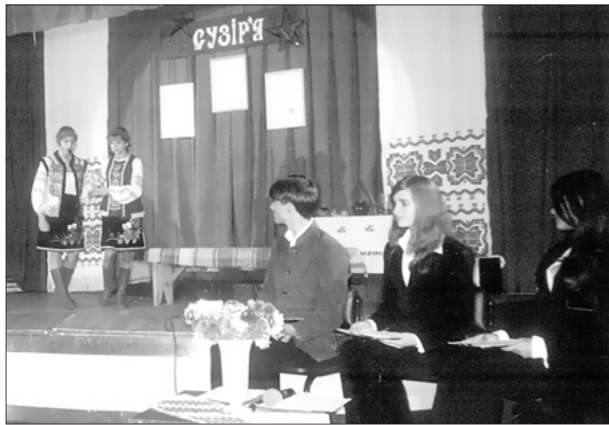
Літературно-музичний альманах "Сузір'я"