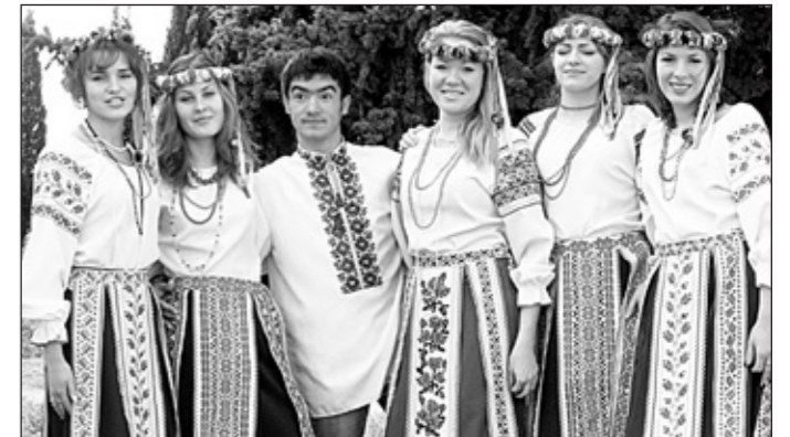
Зразковий вокальний ансамбль "Веснянка"