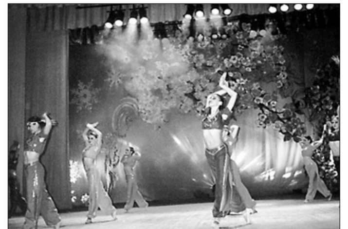
Зразковий театр танцю