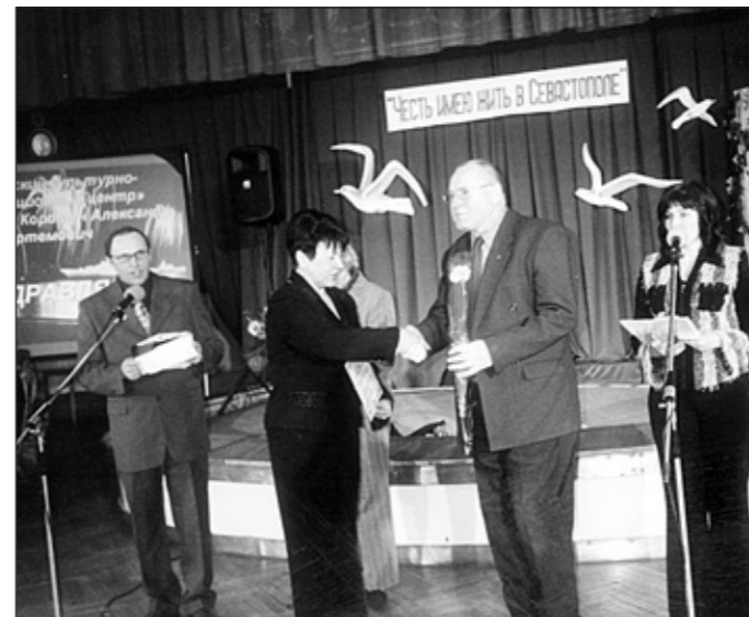
Нагородження лауреатів III форуму інтелігенції міста „Маю честь жити в Севастополі”

Не слід думати, що вирішення всіх цих завдань йшло безболісно, що формування колективу відбулося легко. Ні! Приходили, але швидко звільнялися ті, хто хоча й мав знання з української мови та культури, але кохав не саму культуру, а насамперед себе у ній, хто сподівався влучно попасти у потік і зробити собі ім'я, хто агресивно відносився до інших культур, просто нечесні люди. Колектив позбавлявся від таких „знавців”.