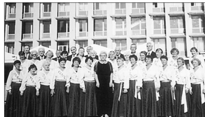
Народний хор ветеранів війни та праці «Лийся, пісне»