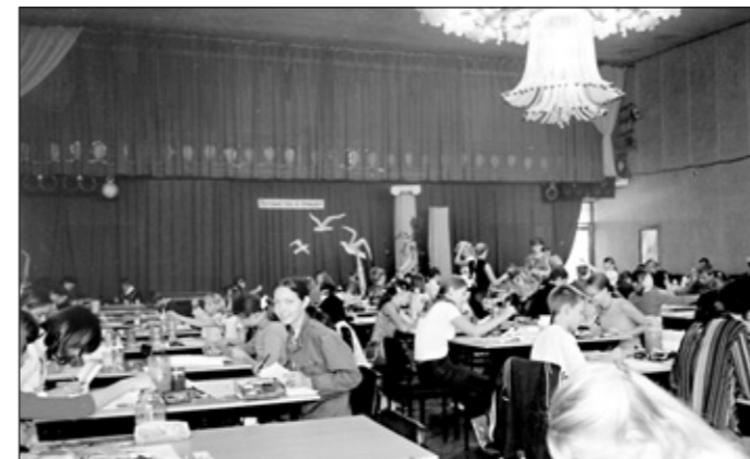
Конкурс дитячого малюнка, присвячений 150-річчю Оборони Севастополя 1854-1855 рр.

Заходи Центру настільки різноманітні, що поле для творчої діяльності та співробітництва широке. В останні роки в нашій державі та у Севастополі також велика увага приділяється екології. Українським культурно-інформаційним центром розроблено сценарій екологічної вікторини, присвяченої Міжнародному дню Чорного моря. Традиційно 31 жовтня вона проходить за активної участі школярів району. Три роки поспіль головним партнером Центру була ТК "ЛІККОМ", яка забезпечувала переможців цікавими та корисними для школярів нагородами. Цього року нам вдалося залучити до співпраці членів Зеленого руху України, зокрема його севастопольське відділення. В 2005 році УКІЦ отримав Грамоту "За значний внесок у пропаганду знань з екології та активну участь у вихованні у молоді бережливого ставлення до оточуючого середовища." Діти та вчителі радо приймають запрошення взяти участь у заходах Центру, бо знають, що в УКІЦ вони отримають не лише поглиблені знання з екології, але й цінні подарунки. В цьому році близько 60 дітей отримали від севастопольського відділення Зеленого руху України заохочувальні призи, а переможці — чудові енциклопедії з захоплюючими розповідями про екологію України, Чорного моря, рослинний та тваринний світ. Не залишилися без уваги й вчителі, які підготували переможців. Вони теж