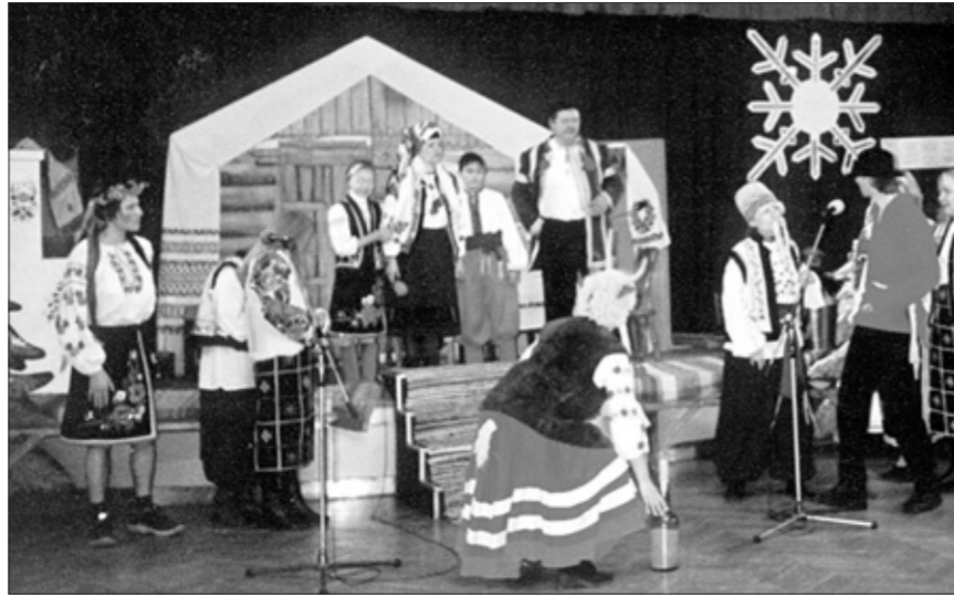
Свято "Від Різдва до Водохреща"

Тривале узгодження деяких позицій мало завершення: 30 січня 1996 року Кабінет Міністрів України прийняв рішення про створення Українського культурно-інформаційного центру в м.Севастополі на базі Палацу культури рибалок, а на підставі цього документу 22 лютого 1996 року Міністерство культури і