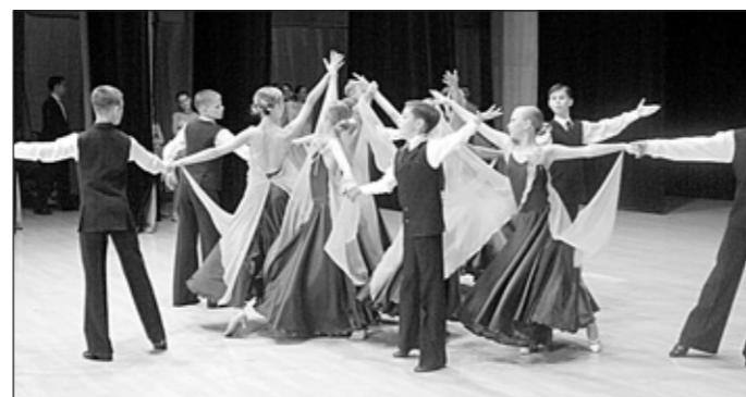
Зразковий ансамбль бального танцю «Ахтіар»