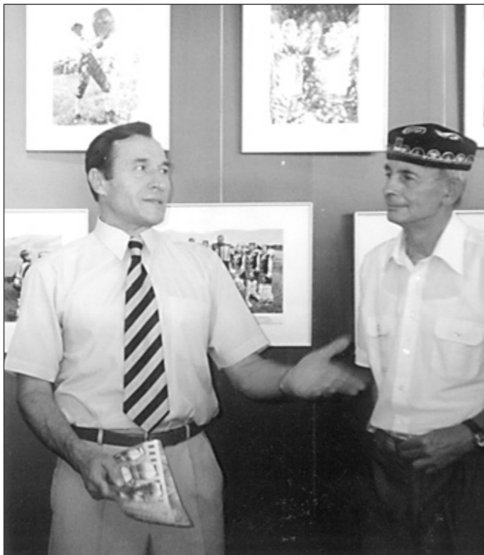
Відкриття Всеукраїнської фотовиставки „Етнічне розмаїття України”