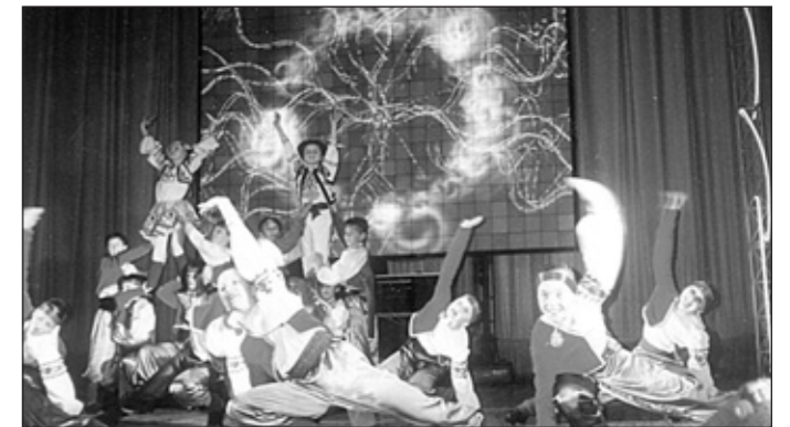
Зразковий хореографічний ансамбль "Атлантика"