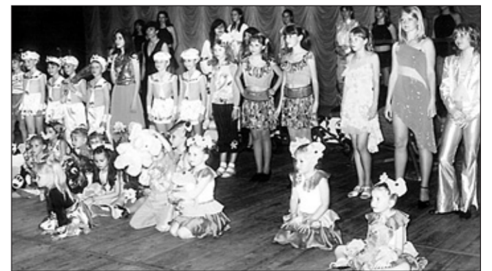
Зразковий вокальний ансамбль "Маленький принц"