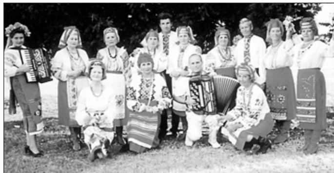
Народний ансамбль «Червона калина»

Та, як відомо, діти виростають. А залишити рідні стіни дехто з них не