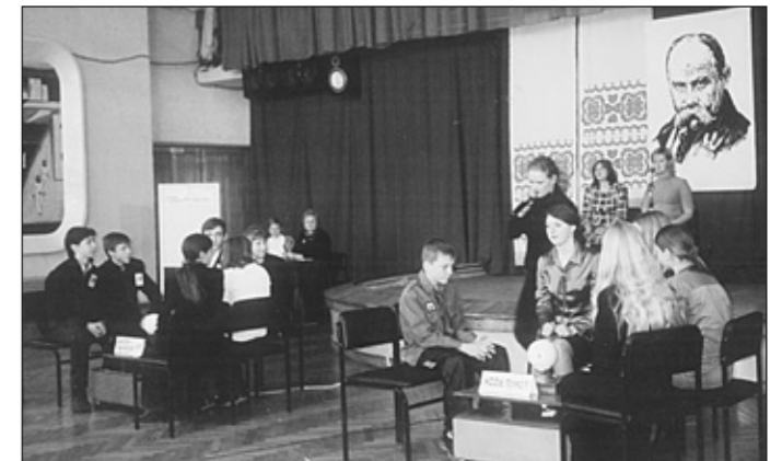
Брейн-ринг, присвячений 190-річчю від дня народження Т.Г.Шевченка

завідуюча інформаційно-методичним відділом